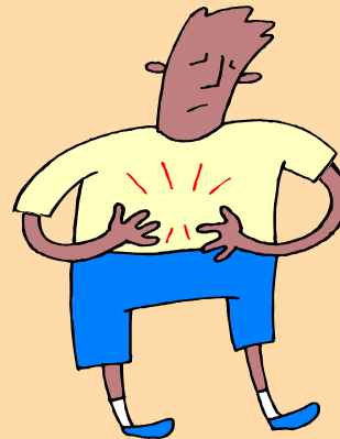
ضيق و صعوبة في التنفس