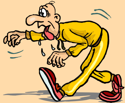
الإصابة بالتعب و التنفس من الفم