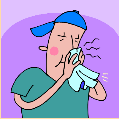
جريان الأنف و الزكام