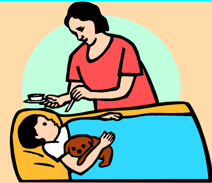
صعوبة في النوم